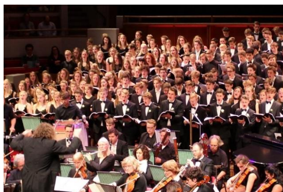
Kooruitvoering van klas 10-12, Tivoli 2017